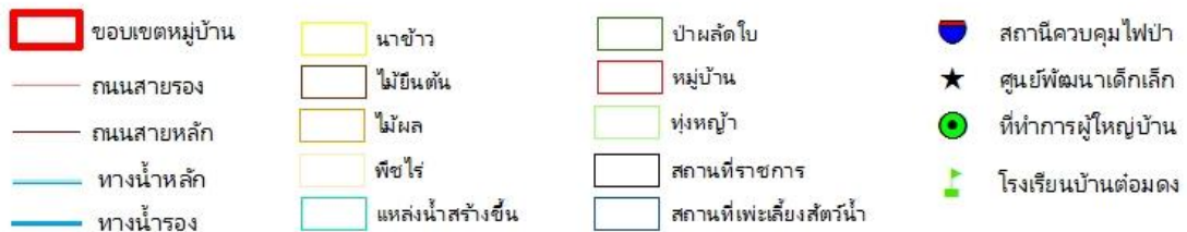
ภาพที่ 1 สภาพการใช้ประโยชน์ที่ดินบ้านต่อมดง (แสดงแนวเขต)