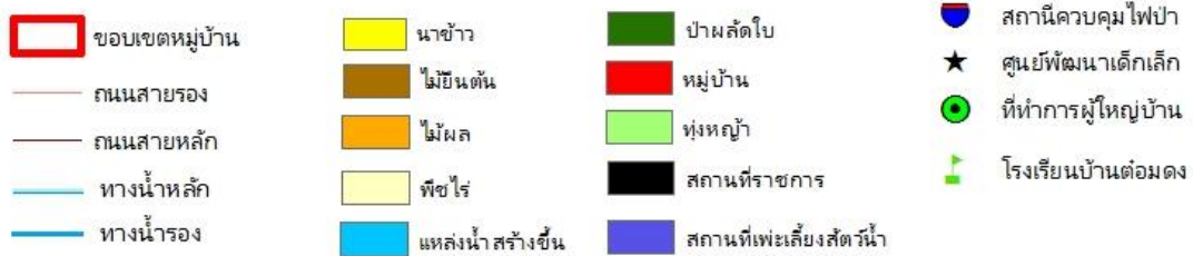
ภาพที่ 2 สภาพการใช้ประโยชน์ที่ดินบ้านต้อมดง (แสดงพื้นที่)