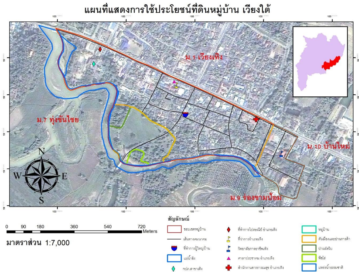
ภาพที่ 1 สภาพการใช้ประโยชน์ที่ดินบ้านเวียงใต้ (แสดงแนวเขต)

ผลการวิเคราะห์สภาพการใช้ประโยชน์ที่ดิน สามารถแสดงดังภาพที่ 1 ภาพที่ 2 และ ตารางที่ 1 ต่อไปนี้